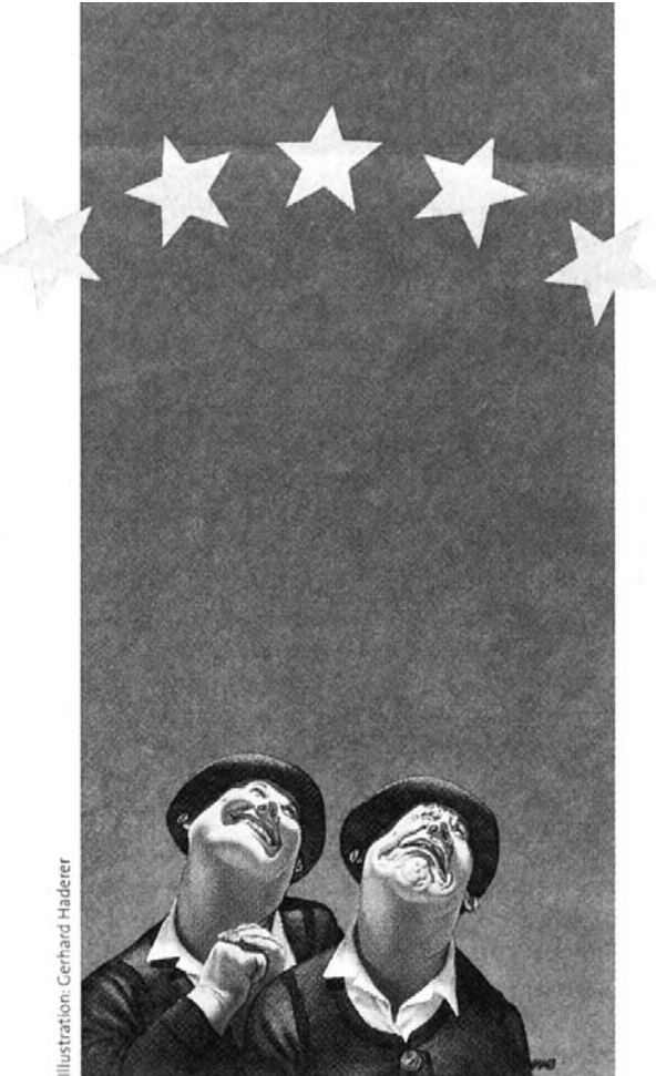
Illustration: Gerhard Harderer

Lange überwunden geglaubte Nationalismen brechen überall in Mittel- und Osteuropa wieder auf und treiben Jugoslawien in den blutigsten Krieg auf europäischem Boden seit dem Zweiten Weltkrieg. Gleichzeitig gerät die Balance innerhalb der EG ins Ungleichgewicht.