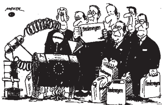
Konsens-Destillation zu Brüssel

Die EU droht bei einem grenzenlosen Wachstum früher oder später Opfer ihres eigenen Erfolgs zu werden. Der zeitliche Aufwand bei der Entscheidungsfindung ist grundsätzlich abhängig von der Größe der Institutionen. Letztlich stellt sich daher nicht nur die Frage, wo die Grenzen der EU sein werden, sondern auch, wie reformfähig die EU in der Zukunft sein wird.